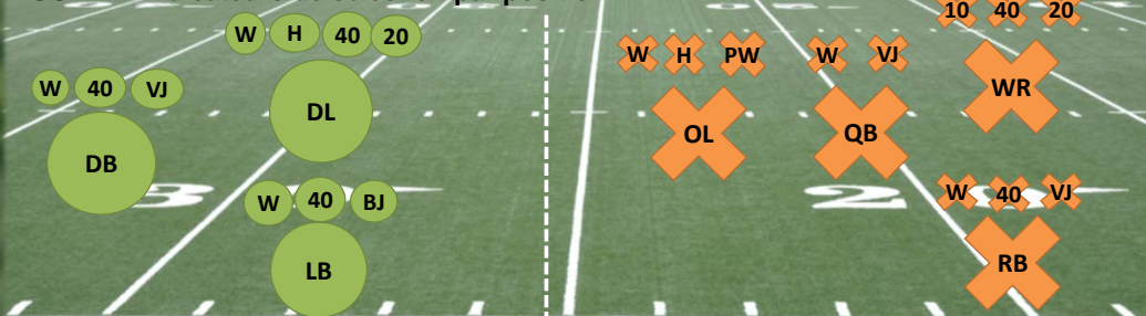
FIGURE 1. Indicateurs de sélection par position

DB = Demi défensif, DL = Ligne défensive, LB = Secondaire, OL = Ligne offensive, QB = Quart-arrière, RB = Porteur de ballon, WR = Receveur de passes, WT = Poids (lb), HT = Grandeur (in), 10Y = 10-verges sprint, 40Y = 40-verges sprint, 20S = 20-verges shuttle run, VJ = Saut vertical, BJ = Saut en longueur, 3C = Course 3-cônes, SP = Temps de réaction, PW = Déploiement de puissance..