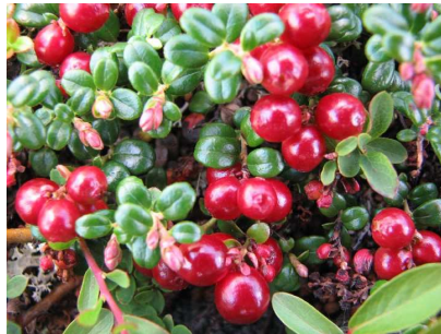
UNE COMPILATION FRUCTUEUSE