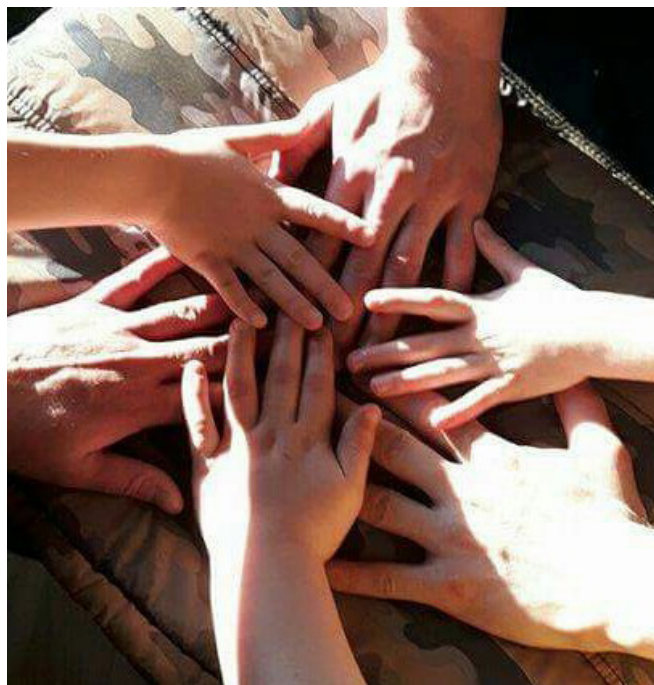
Un pour tous, tous pour un!