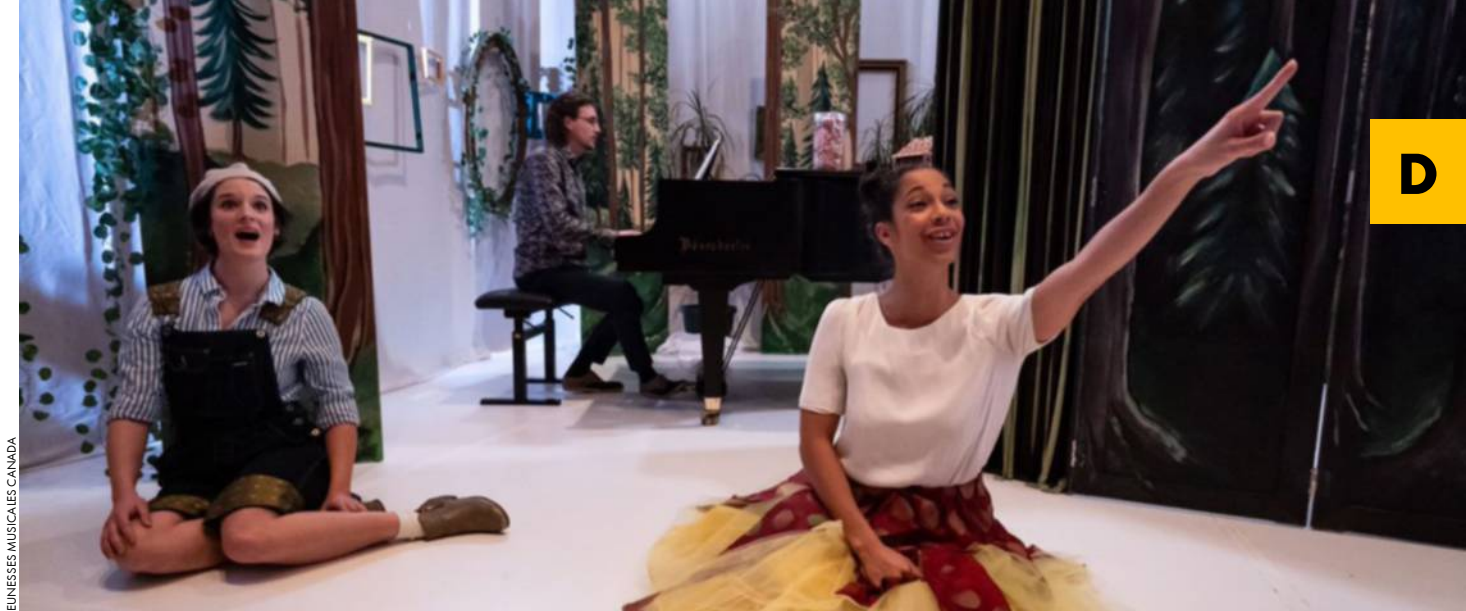
JEUNESSES MUSICALES CANADA