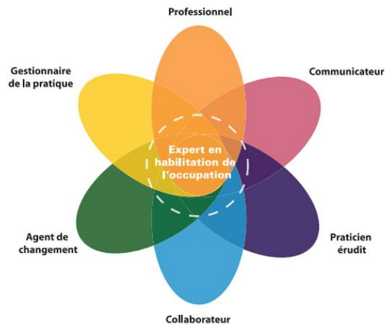
Figure 1 Profil de la pratique des ergothérapeutes au Canada