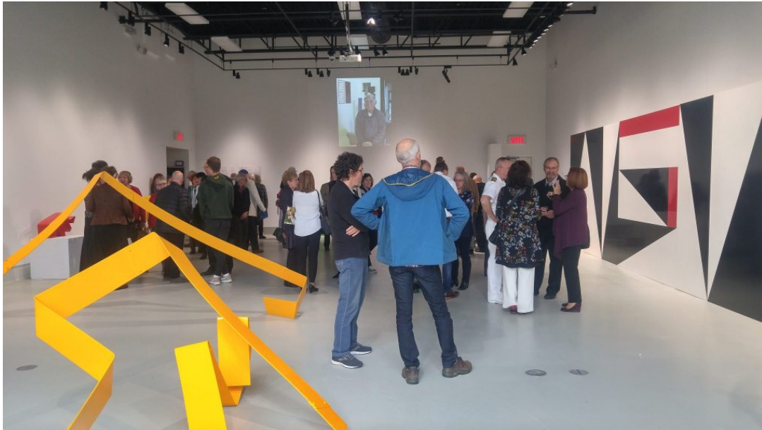
Vernissage à la Galerie R3 de l'UQTR.

Ce dimanche 30 septembre 2018 en après-midi a eu lieu le vernissage de Hommage à l'Homme et son œuvre . Cette exposition propose une rétrospective des 50 années de création du sculpteur trifluvien Pierre Landry , artiste prolifique jouant principalement avec les perspectives et la lumière.