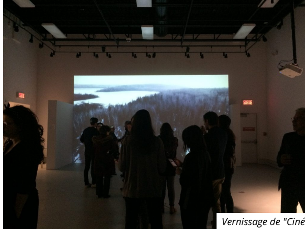
Vernissage de "Cinétique".