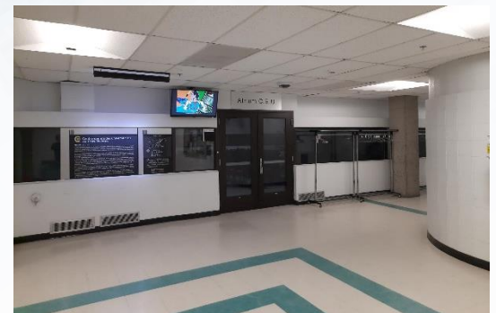
Entrée de l'Atrium au Pavillon Ringuet

Adresse de l'Université du Québec à Trois-Rivières 3351, boulevard des Forges, Trois-Rivières (Québec) G8Z 4M3