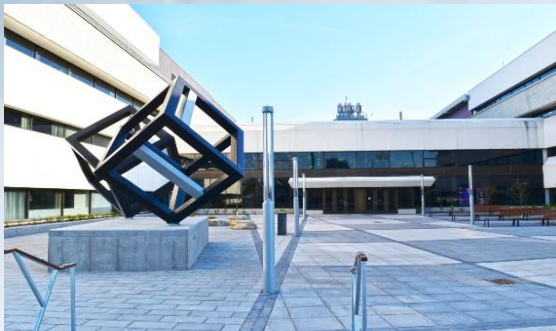
Entrée principale et les fameux Cubes

Les ateliers de l'après-midi seront dispersés dans des locaux divers à proximité de l'Atrium et de l'Auditorium. Un plan vous sera envoyé par courriel, à l'approche de la date de l'événement, quand vous aurez confirmé et payé votre inscription.