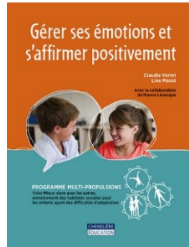
Illustration à partir du développement d'un programme d'habiletés sociales ciblé pour les élèves ayant des problèmes d'autorégulation