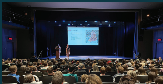
Théâtre / Cégep de Trois-Rivières