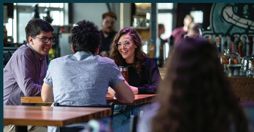
Bistro / UQTR