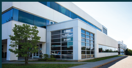
L'UQTR offre des cliniques universitaires ouvertes à tous