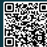
Cégep de Shawinigan