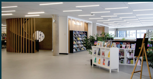
Bibliothèque / Cégep de Trois-Rivières