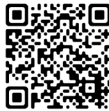
Cégep de Shawinigan