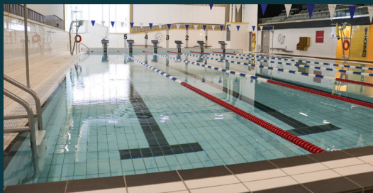
Piscine / Cégep de Shawinigan