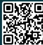
Cégep de Trois-Rivières