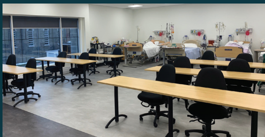
Salle de classe au Centre d'études collégiales (CEC) La Tuque / Cégep de Shawinigan