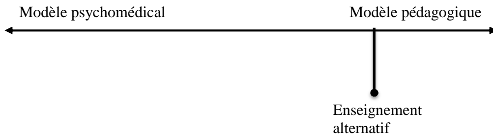
Figure 3. Continuum de l'enseignement alternatif

Donc, si on analyse bien le continuum, il serait également possible de placer le niveau de collaboration entre l'orthopédagogue et l'enseignant, allant de la collaboration la plus brève et élémentaire du pôle du modèle psychomédical à la collaboration la plus étroite au pôle du modèle pédagogique.