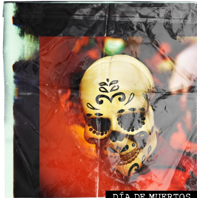
DÍA DE MUERTOS

Par exemple, un.e enseignant.e propose à ses élèves de fabriquer des masques calavera dans un cours d'arts plastiques. L'activité proposée est très populaire à l'Halloween. Cependant, ces masques n'ont pas de lien avec cette fête commerciale où friandises et déguisements sont à l'honneur. Les masques calavera proviennent plutôt du Día de Muertos (le jour des morts) : une fête qui honore la mémoire de proches qui sont décédés.