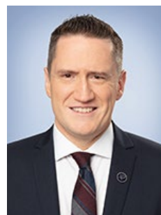
Benoît Charrette Député de Deux-Montagnes Coalition avenir Québec Ministre de l'Environnement, de la Lutte contre les changements climatiques, de la Faune et des Parcs Ministre responsable de la région des Laurentides