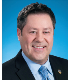
Pierre Michel Auger Député de Champlain

Bureau de circonscription 278, rue Saint-Laurent, Trois-Rivières (Québec) G8T 6G7 Tél. : 819 694-4600 | Téléc. : 819 694-4606 pierre-michel.auger.chmp@assnat.qc.ca