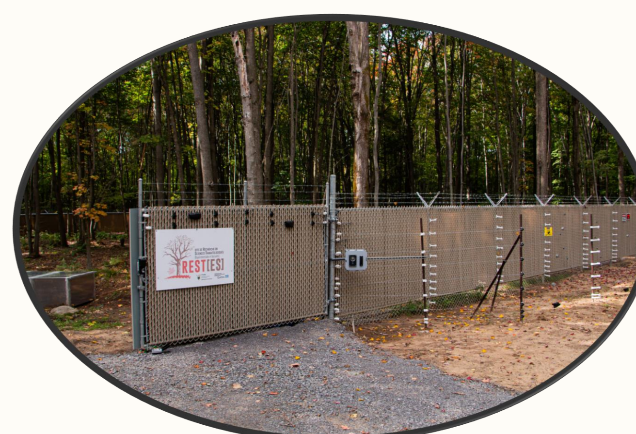
Figure 2 – Site REST[ES]

( https://www.mindat.org/taxon-1038971.html )