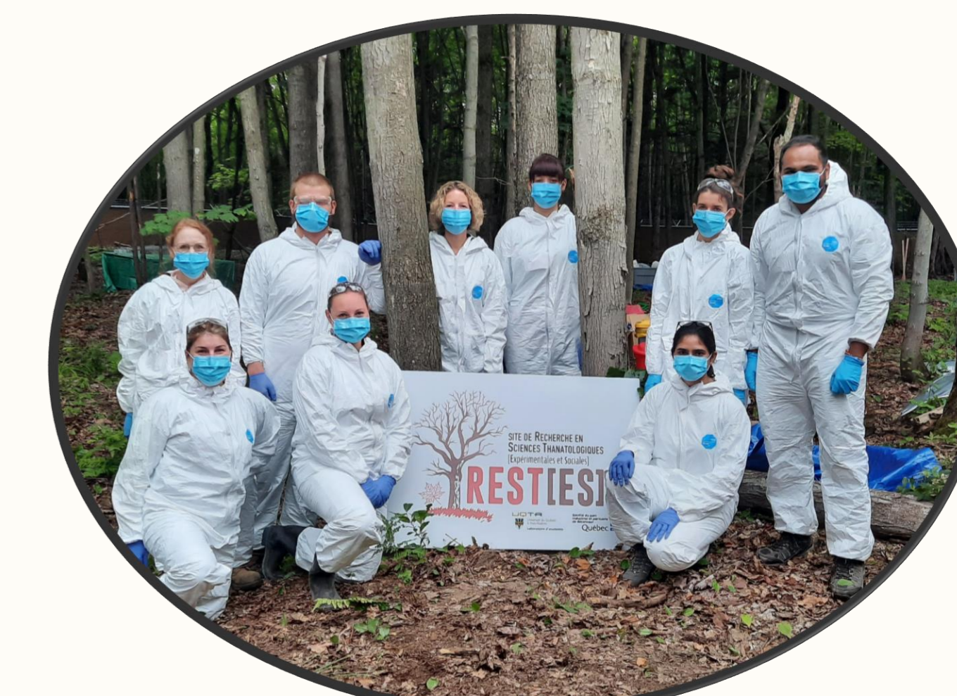
Figure 4 – Équipe du site REST[ES]